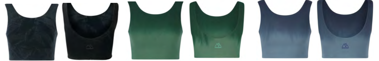
STONE WASH BLACK