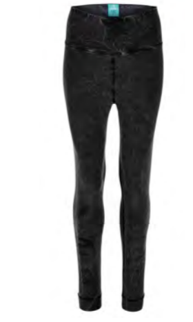
STONE WASH BLACK