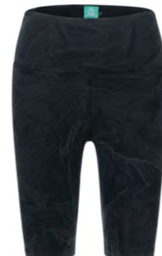
STONE WASH BLACK